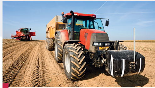
Agriculture mécanisée aux Pays-Bas (céréales) : rendement de 9 tonnes/hectare.

■ L'agriculture productiviste livre des productions de masse destinées au commerce et à l'exportation : grandes exploitations, peu d'agriculteurs, beaucoup de moyens techniques, rendements élevés.