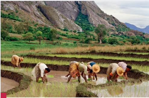
Riziculture à Madagascar : rendement de 2 tonnes/hectare.

■ L'agriculture vivrière est destinée à nourrir la famille : petites exploitations, travail essentiellement manuel, peu de moyens techniques rendements faibles.