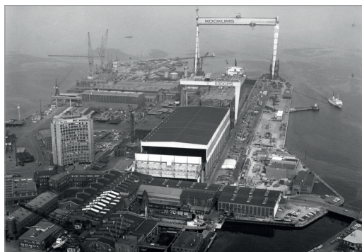
1 Vastra Hamnen : hier, des chantiers navals

■ Dans certains cas, il s'agit de réhabiliter d'anciens bâtiments (usines, entrepôts) pour les affecter à une nouvelle fonction (logements, centre de loisirs). Les anciens quartiers industriels ou portuaires sont généralement transformés en quartiers résidentiels respectant les principes du développement urbain durable .