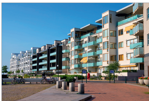
2 Aujourd'hui, des résidences et des logements